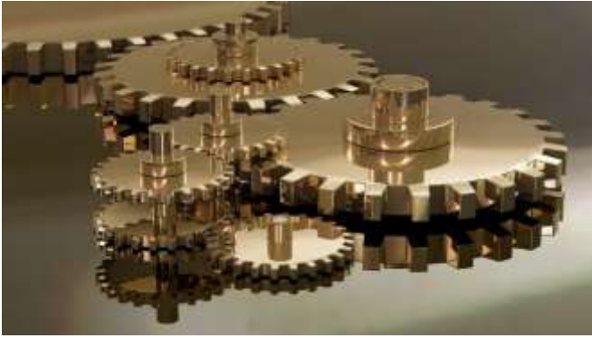
Notulant: Anneleen Arnolds